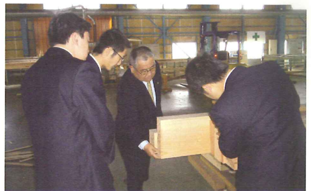
伊賀プレカットでの工場見学